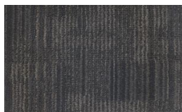
001 - Plush