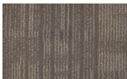
005 - Suede